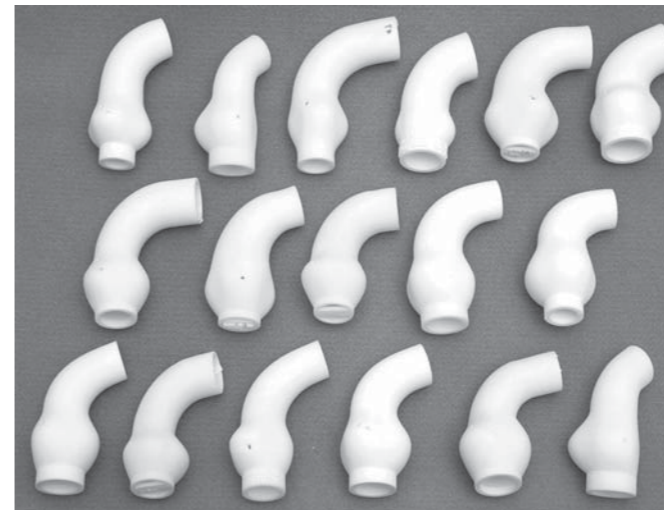
Repliky aort rôznych pacientov, vytvorených ako formy na vytváranie sieťky ExoVasc®, ukazujú rôznorodosť tvaru a veľkosti, ktoré je možné pomocou tejto techniky úspešne modelovať.

Osobná podpora pre každého pacienta PEARS (Personalised External Aortic Root Support, teda Externá personalizovaná podpora koreňa aorty) je chirurgická metóda, ktorá bráni rozširovaniu vzostupnej aorty pevnou vonkajšou polyesterovou sieťkou