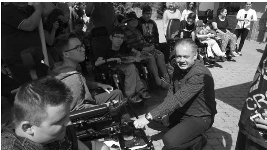
Prezident SR Andrej Kiska na návšteve letného tábora pre mládež v Zuberci