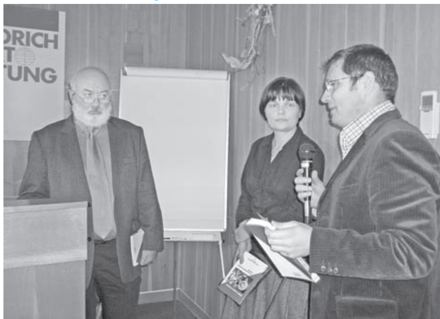
Na Valnom zhromaždení SAPN predstavili aj odbornú publikáciu: „Chudoba v slovenskej spoločnosti a vzťah slovenskej spoločnosti k chudobe“, ktorú vydal Sociologický ústav SAV.

Podľa prieskumu potrieb členov SAPN sa ich očakávania zameriavajú na možnosť spoločnej medializácie stanovísk,