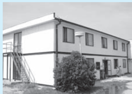
Útulok Mea Culpa na Hradskej ulici v Bratislave

Mali ste v zime nejaké problémy s návštevníkmi?