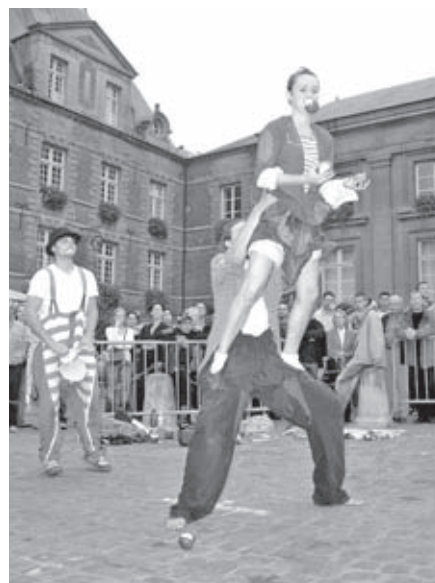
Bábkové predstavenie Zvedavý sloník na svetovom bábkarskom festivale v Charleville-Mezières vo Francúzsku v septembri 2006.

Ambíciou projektu vlaňajšieho bábkového predstavenia na motívy poviedky „ZVEDAVÝ SLONÍK“, z knihy „Rozličné poviedky“ Rudyarda Kiplinga, bolo okrem turné po Slovensku, prezentovať sa aj na Svetovom festivale bábkových divadiel vo francúzskom meste Charleville Mezières v septembri 2006, čo sa skutočne podarilo a malo vo Francúzsku veľký ohlas.