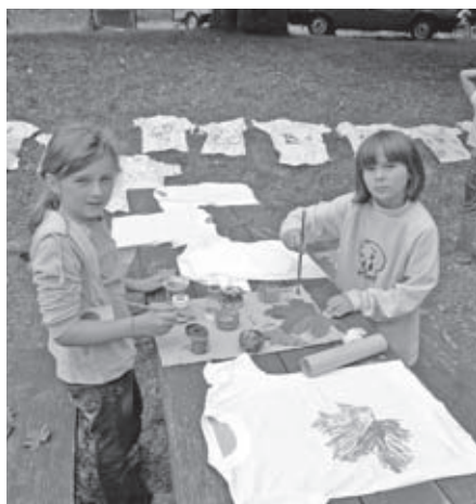
Tvorivé dielne v letnom tábore v Chtelnici.