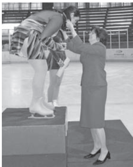
Mladým športovcom počas majstrovstiev držala palce a v ich závere odovzdávala diplomy a medaily aj prvá dáma Slovenska, Silvia Gašparovičová.